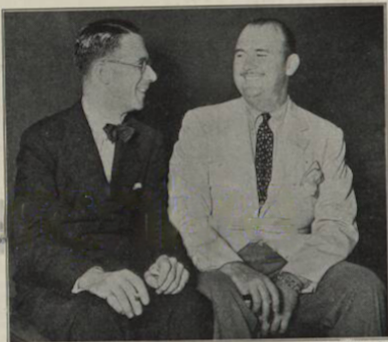
Henry Hall and Paul Whiteman in merry mood

Cotton Club to meet the Blue Rhythm Band? There is only one word for this band's technique. Colossal. The brass players here show once again that the coloured men of either Duke Ellington's, Cab Calloway's or this band have that undeniable talent for rhythm which stands pre-eminent in the world of dance music. I got the greatest thrill out of the performance of the pianist. He is brilliant in the extreme and would cause a riot among pianists in this country were he ever to appear here.